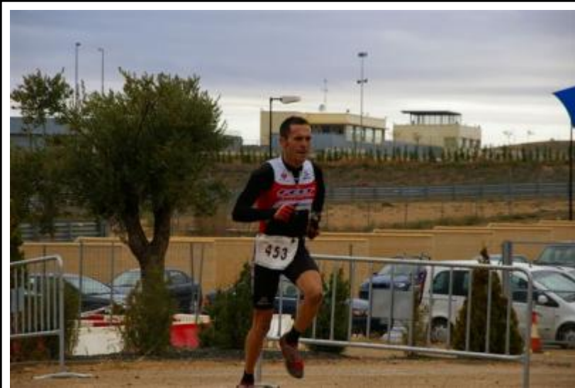
Imágenes del Duatlón Cross de Alcañiz

La prueba, valedera para la XIII Copa Aragonesa de Duatlón Cros, se disputaba en el circuito de Motorland bajo unas condiciones adversas de lluvia, viento y frío, con una participación de 105 corredores.