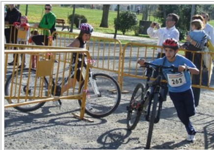
Aletas en transición.

JACA.- Como aperitivo de la prueba de los mayores, este sábado se disputó una vez más la versión infantil del Duatlón Cross Trofeo Mayencos. Ha sido la quinta edición de una prueba que poco a poco va convirtiéndose en un magnífico escaparate para que los más pequeños descubran este deporte y aprendan sus particularidades. Un total de 36 chicos de entre 6 y 16 años participaron en las tres carreras diseñadas para las categorías de iniciación, prebenjamín, benjamín, alevín e infantil con clasificaciones mixtas. Y es que las chicas demostraron un gran estado de forma en todas las categorías. Un sorteo de regalos puso la guinda final a la deportiva mañana en el llano de Samper de Jaca.