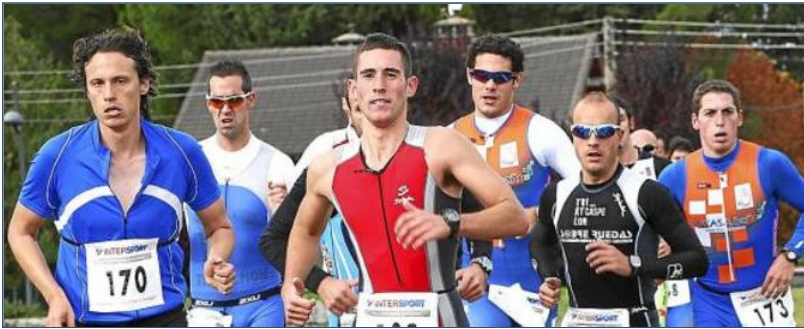
Imagen de la prueba que se celebró ayer en Jaca. MAYENCOS-FELT TRIATLÓN

El corredor gana el Trofeo Mayencos y comienza con buen pie la Copa Aragonesa.