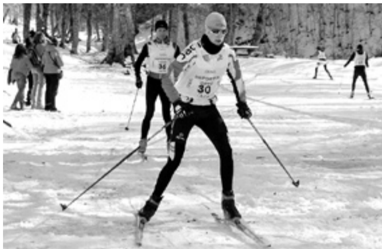
Los triatletas, ya con los esquís en la parte final.

En chicos, se destaca en la carrera a pie Apilluelo, de Mayencos Brico-Jaca Triatlón. A