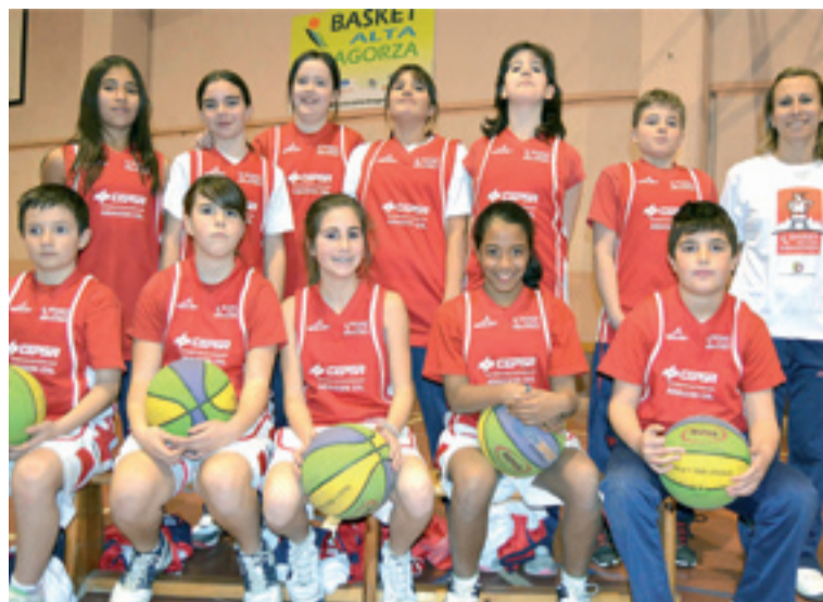
Alevín A. s. e.