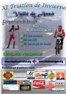
Cartel de la prueba deportiva

La Villa de Ansó, la Asociación Deportiva Linza, la Asociación Deportiva Talón libre y el Club Pirineísta Mayencos organizan el XI Triatlón de Invierno "Valle de Ansó". La prueba se celebrará este domingo 20 de febrero a las diez de la mañana, siendo Campeonato de Aragón de Triatlón de Invierno 2011, y prueba puntuable para el Ranking Nacional de Triatlón de Invierno. La prueba se presentará este jueves por la mañana en la sede de la Comarca de la Jacetania en Jaca.