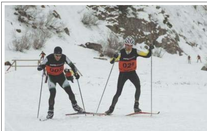
A expensas de la nieve. Así están ahora los organizadores del XI Triatlón de Ansó.

La cita, prevista para el próximo domingo 13 de febrero, podría posponerse una semana más debido a las previsiones meteorológicas desfavorables para la realización de la prueba de esquí de fondo.