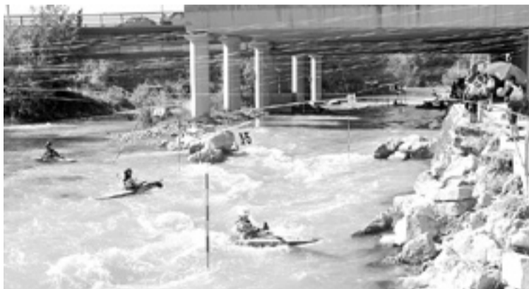
El Canalet de Fraga tiene esta temporada importantes citas. JAUME CASAS

en Aragón y tendrá su prueba de fuego a principios de abril, los días 2 y 3, con la celebración de una prueba de la Copa de España, dónde participarán los mejores palistas españoles.