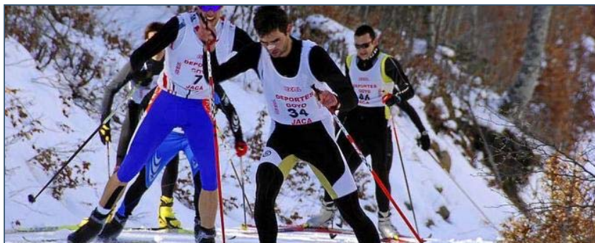
Un momento de la competición de esquí de fondo del triatlón..