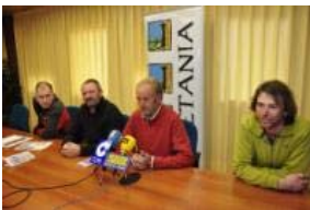
Momento de la presentación en la sede de la Comarca de la Jacetania

Los organizadores del Triatlón de Invierno de Ansó apuestan por la continuidad de la prueba, y se marcan como objetivo que la Jacetania sea el referente aragonés en el triatlón de Invierno. El Triatlón de Invierno "Valle de Ansó" llega ya a su undécima edición, aunque no de forma continuada. La prueba se celebra este domingo 20 de febrero a las diez de la mañana, siendo Campeonato de Aragón de Triatlón de Invierno 2011, y prueba puntuable para el ranking