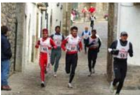
Momento de la carrera el pasado año

Organizada por el Ayuntamiento de Ansó, la Sociedad Deportiva Linza, el Club Pirineista Mayencos, y con la colaboración de un buen número de entidades del Valle y Comarca, el próximo domingo 13 de febrero está prevista la celebración del XI Triatlón de Invierno "Valle de Ansó", asentada definitivamente en el calendario y que año a año tiene más aceptación, hasta tal punto que la organización ha tenido que poner el límite en 150 participantes para no verse desbordada