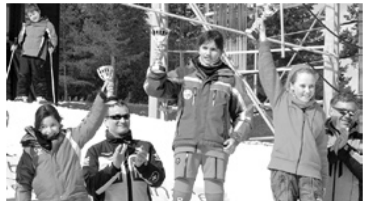
Uno de los podios femeninos del fin de semana. s.e.