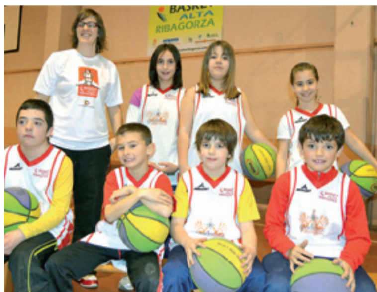
Alevín B. s. e.