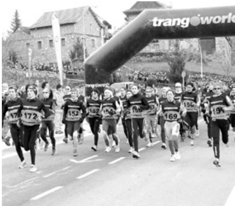
Imagen de la salida de las féminas de la pasada edición de 2010.