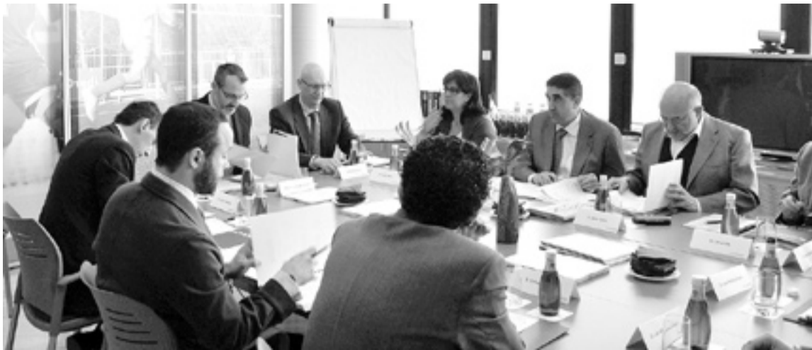
Imagen de la reunión que decidió los primeros premios de la gala. S.E.