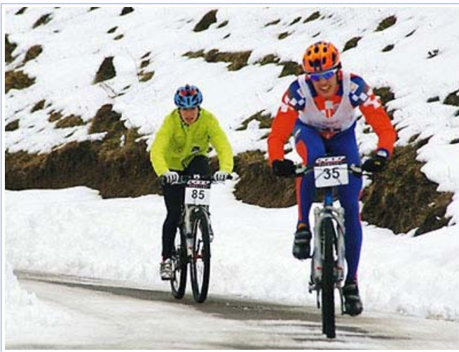
FOTO: Ascenso en BTT de Ansó a Linza.

© Pirineodigital.com - PROHIBIDA SU REPRODUCCIÓN TOTAL O PARCIAL - Contacto - Cómo insertar publicidad