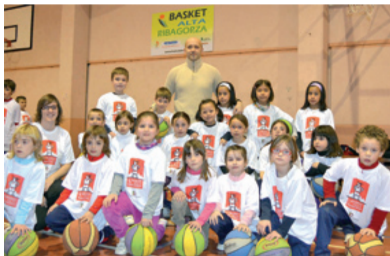
Grupo de Escuelas. s. e.