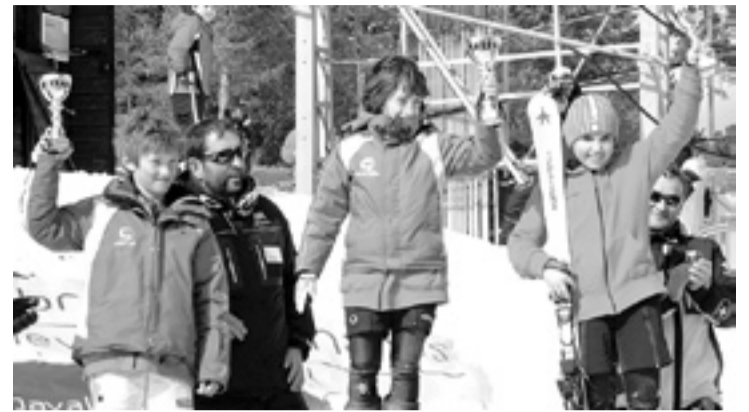
Podio masculino en la pista bajoaragonesa. s.e.